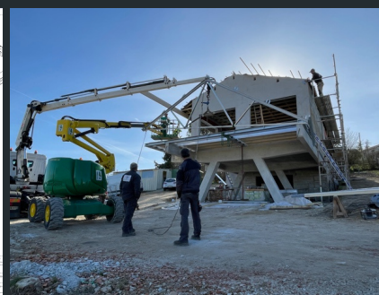
Livraison et montage sur site